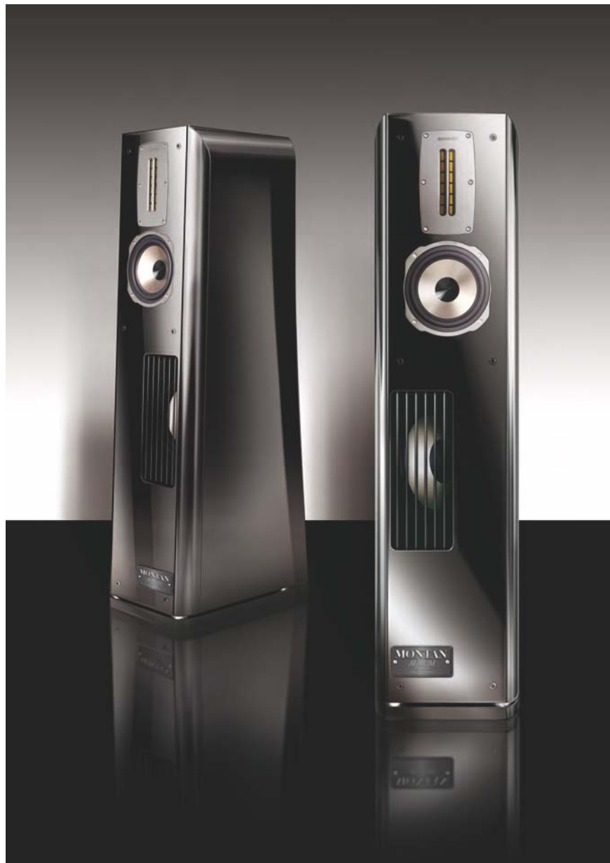
AURUM MONTAN VIII, Farbe: schwarz hochglanz