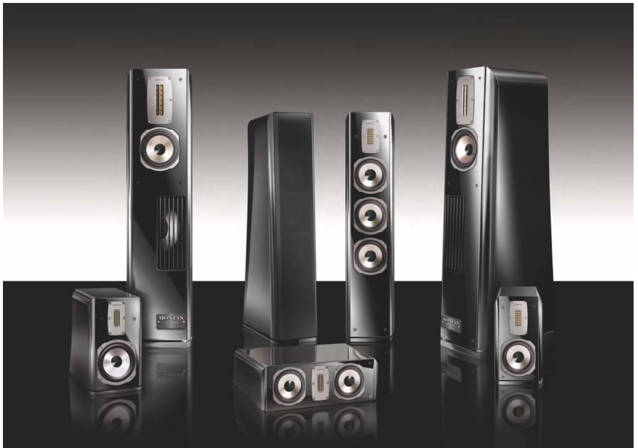
AURUM MONTAN VIII, AURUM WOTAN VIII, AURUM ALTAN VIII, AURUM BASE VIII, AURUM MEGAN VIII Farbe: schwarz hochglanz